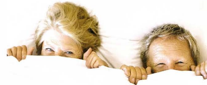
Gesund leben – eine wichtige Grundlage, um gesund zu bleiben.